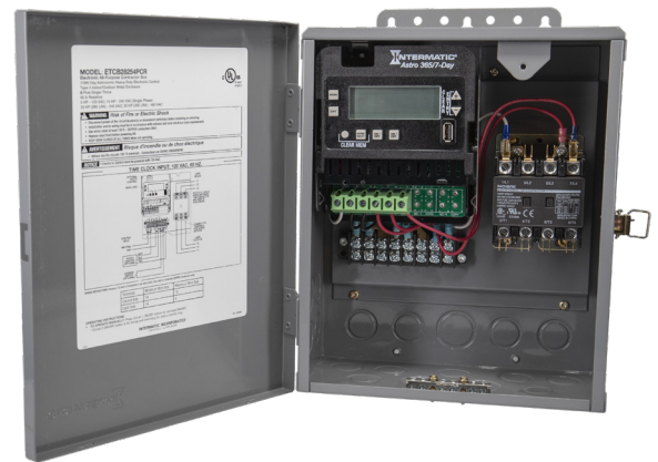
Se muestra una caja metálica bloqueable para interiores/exteriores con la tapa frontal abierta

Siga estas instrucciones para completar la instalación y la programación de la caja de contactor de iluminación de 4 polos ETCB28254PCR.